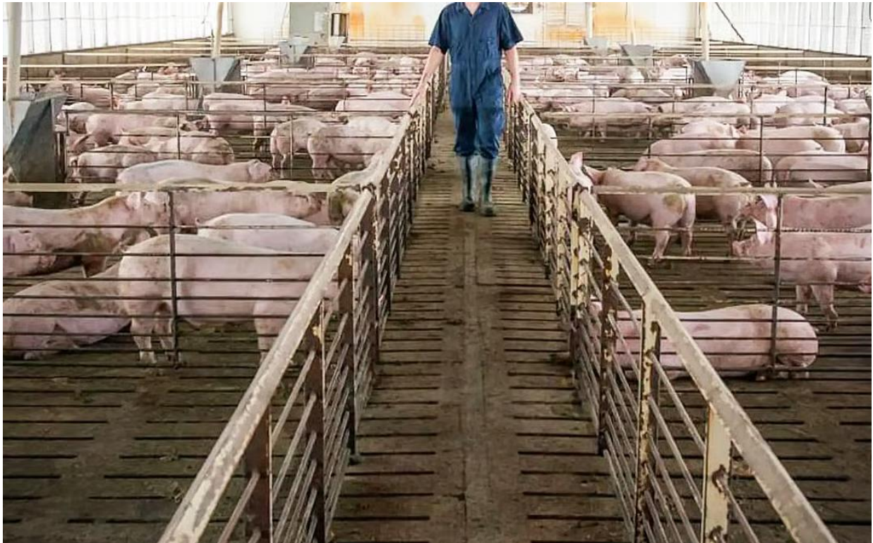
Exco Perak A Sivanesan berkata hukuman seperti kompaun wajar dikenakan kerana kerja awal di tapak sebelum mendapat kebenaran dan kelulusan tidak patut dinormalisasi.

PETALING JAYA: Projek ladang babi moden di Jalan RE, Jalong, Sungai Siput diarahkan berhenti kerana tidak mendapat kebenaran merancang (KM) daripada pihak berkuasa tempatan (PBT).