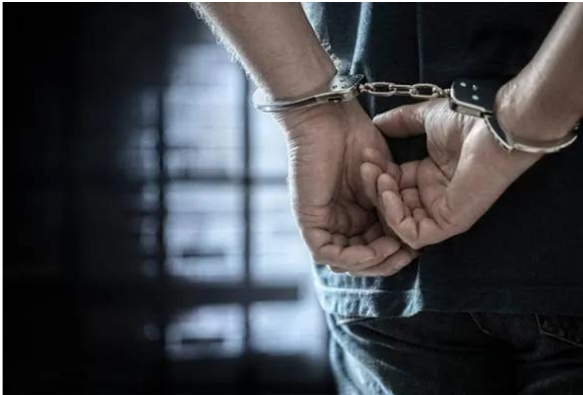
Pasukan Gerakan Am (PGA) menahan empat lelaki tempatan disyaki terlibat kegiatan menyeludup haiwan ternakan tanpa permit menerusi Ops Taring Kandang di Jalan Baling-Gerik di Gerik hari ini. - Foto hiasan

IPOH: Pasukan Gerakan Am (PGA) menahan empat lelaki tempatan disyaki terlibat kegiatan menyeludup haiwan ternakan tanpa permit menerusi Ops Taring Kandang di Jalan Baling-Gerik di Gerik hari ini.