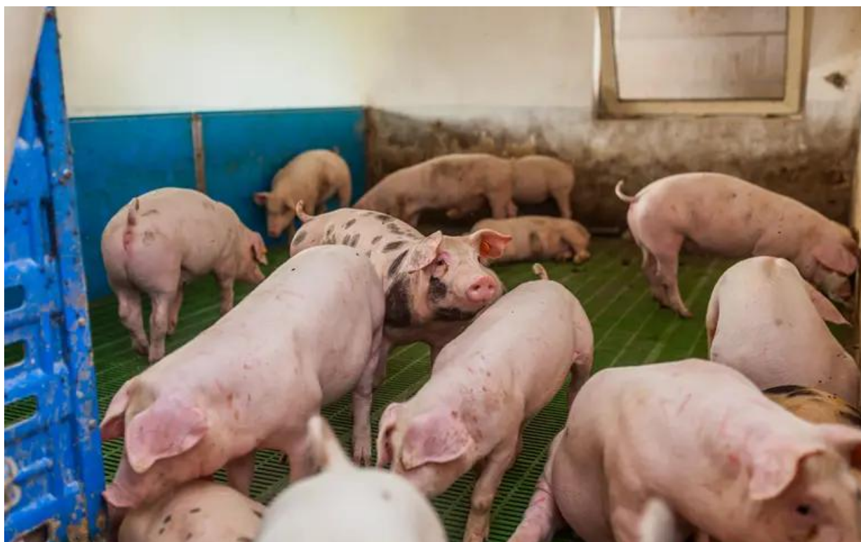
Three abattoirs in Brazil and four in Thailand have been approved for pork exports to Malaysia, said the agriculture and food security ministry.

PUTRAJAYA: The veterinary services department (DVS) has approved imports of pork from Thailand and Brazil to ensure sufficient supply ahead of the Chinese New Year festivities.