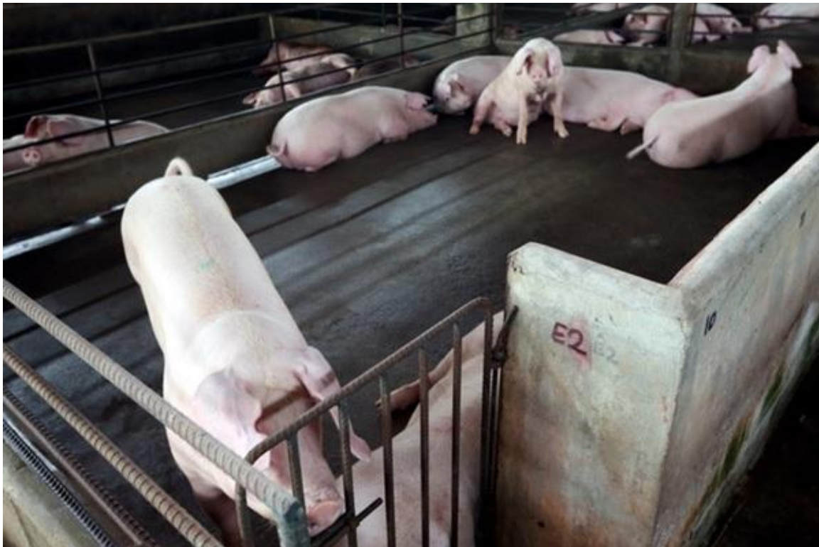
Gambar hiasan BERNAMA

PUTRAJAYA: Jabatan Perkhidmatan Veterinar (DVS) meluluskan pengimportan daging babi dari Thailand dan Brazil untuk menampung keperluan bekalan di pasaran tempatan semasa musim perayaan Tahun Baharu Cina (TBC).