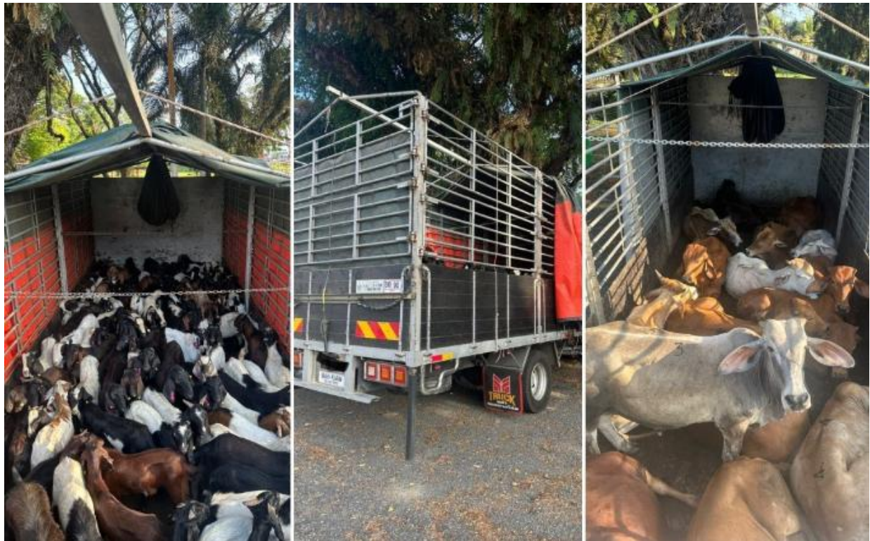
Kredit PGA Ulu Kinta

IPOH: Pasukan Gerakan Am (PGA) menahan empat lelaki tempatan disyaki terlibat kegiatan menyeludup haiwan ternakan tanpa permit menerusi Ops Taring Kandang di Jalan Baling-Gerik di Gerik hari ini.