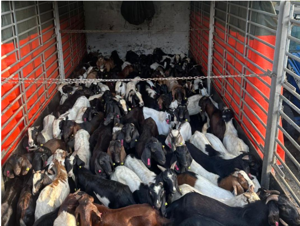
SEBAHAGIAN haiwan ternakan yang dipercayai diseludup, dirampas dalam Op Taring Kandang di Jalan Gerik-Baling hari ini.

GERIK – Sebanyak 117 ekor kambing dan 18 ekor lembu dipercayai diseludup dari negeri di Pantai Timur bernilai RM686,300 dirampas dalam Op Taring Kandang di Jalan Gerik-Baling, di sini hari ini.